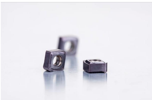
Bild 1: Die doppelseitigen CNHX05-Platten von Dormer Pramet verfügen über bis zu vier Schneidkanten.