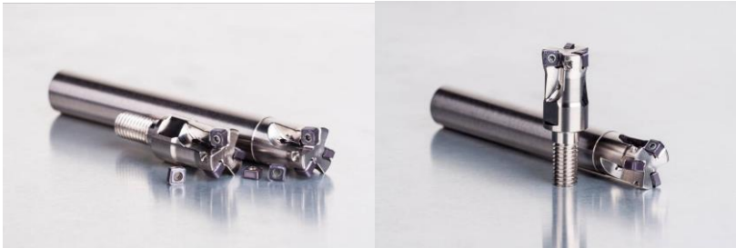
Bild 2 und 3: Die neuen hochproduktiven SCN05C-Fräswerkzeuge von Dormer Pramet zeigen vor allem im Werkzeug- und Formenbau ihre Stärke beim produktiven Kopierfräsen von Stählen, gehärteten Stählen und Gusseisen.

Download: http://www.pr-x.de/fileadmin/download/pictures/Dormer_Pramet/CNHX_05_Inserts.jpg